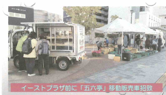
イーストプラザ前に「五六亭」移動販売車招致