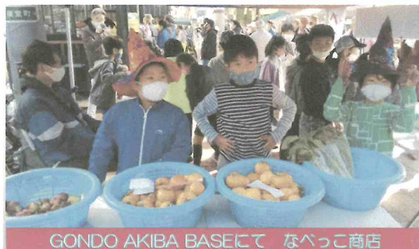
GONDO AKIBA BASEにて なべっこ商店