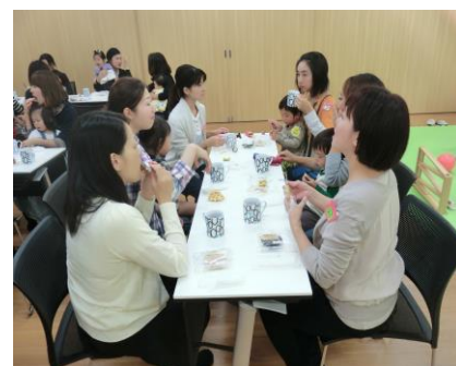
美味しい珈琲で会話もはずむ