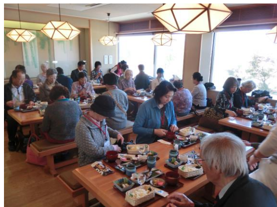
ひとり暮らしの高齢者のつどいに参加の皆様