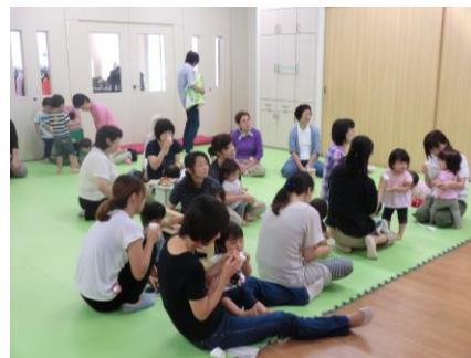
みんなでお味噌汁