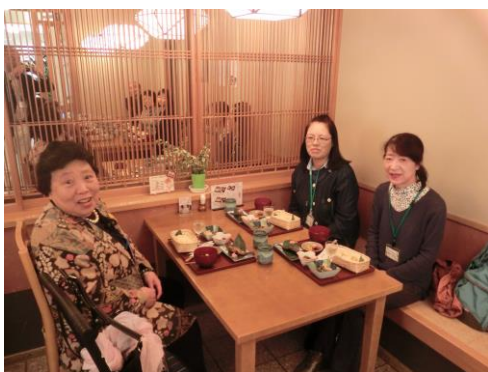
秋の味覚「栗おこわ」を楽しむひと時です