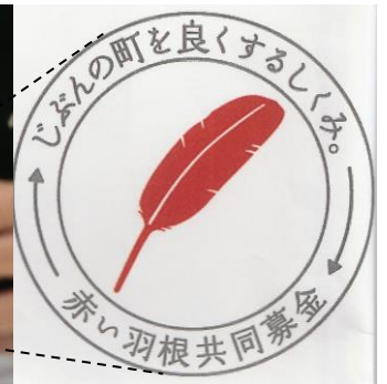
ラジオの裏面には共同募金のシールが貼られています