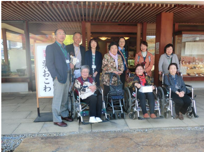
きぼうの旅に参加の皆様