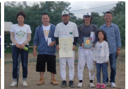
優勝した東鶴賀町チーム