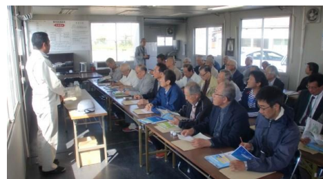
リサイクルセンターの意義と目的などについて、説明を受ける