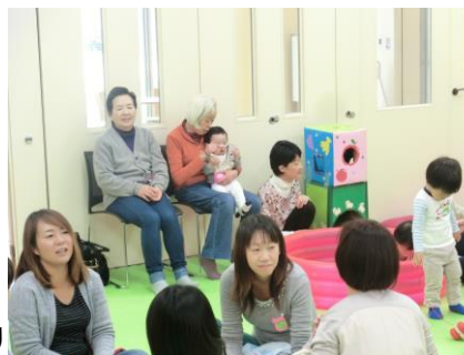
子供たちものんびり