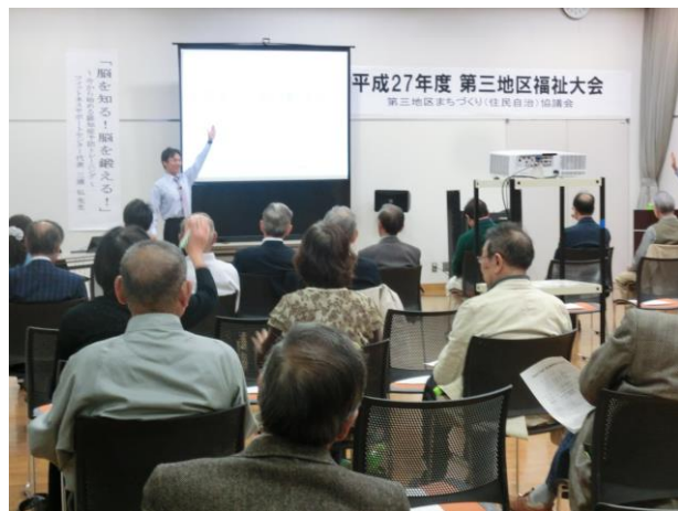
約60名の参加で熱気ムンムン！