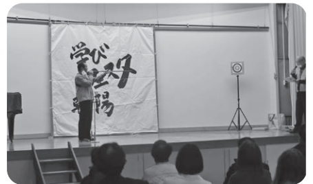
(ステージ発表) 朝陽吹矢同好会

精神統一し、6m先の的へ矢が一直線に。見事に矢が刺さると会場から「おおー」の歓声が入り！