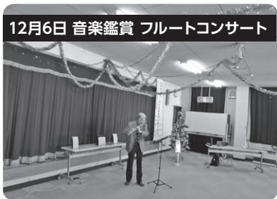
12月6日 音楽鑑賞 フルートコンサート