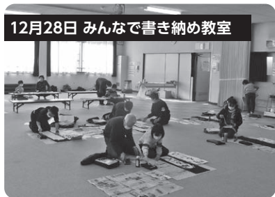
12月28日 みんなで書き納め教室

講師：朝陽地区の書道経験のあるボランティアの方4名 初めての長い紙に苦戦しつつも堂々とした作品が完成しました(参加者16名)