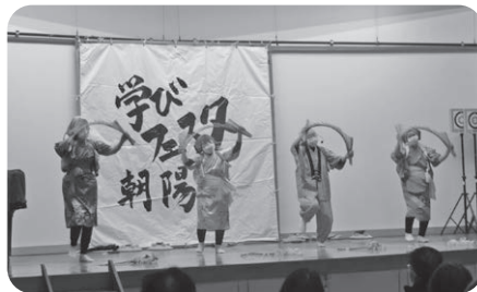
(ステージ発表) 南京玉すだれシスターズ

マスクでしたが、体育館に響く素晴らしい歌声でした 観客も一緒に大きな古時計など3曲を歌いました