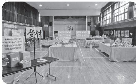
(展示発表) 会場の様子

学びフェスタを最後にサークル「朝陽水墨会」は解散となります。毎年素晴らしい作品を展示していただき、ありがとうございました