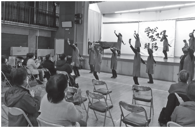
(ステージ発表) 信濃和っしょいによる「よさこい踊り」 おそろいの衣装で軽快に

風はまだまだ冷たいものの、日差しに春の訪れを感じる3月3日の午後と3月4日の2日間、朝陽公民館体育館を会場に「学びフェスタ朝陽2023」を開催し、160名余の方にお越しいただきました。 展示発表は、成人学校「ボールペン字」のほか、「水墨画」「紙バンドのバッグ」「子ども生け花」などのサークルの作品に加え、一般の方からも多数出展していただき、90点余りの作品をご覧いただくことができました。また、4年ぶりとなったステージ発表も4団体のみの出演となりましたが、出演者と観客が一体となつて、手拍子をしたり歌を歌ったりと会場全体で盛り上がりました。 他にも、ヨガ体験や血管年齢測定、障害者施設と養護学校高等部による模擬店の出店もあり、賑やかな学習発表会となりました。