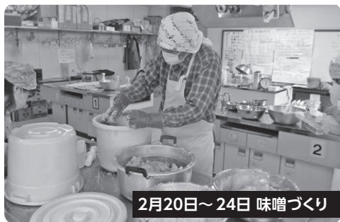
2月20日~24日 味噌づくり

豆腐作りにつづき、自分たちで栽培した大豆を煮て塩と麴を混ぜ、味噌を仕込みました。「おいしい味噌にな~れ」と願いを込め、秋以降の仕上りに期待します(参加者21名)