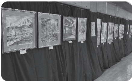
(展示発表) 朝陽水墨会

風はまだまだ冷たいものの、日差しに春の訪れを感じる3月3日の午後と3月4日の2日間、朝陽公民館体育館を会場に「学びフェスタ朝陽2023」を開催し、160名余の方にお越しいただきました。 展示発表は、成人学校「ボールペン字」のほか、「水墨画」「紙バンドのバッグ」「子ども生け花」などのサークルの作品に加え、一般の方からも多数出展していただき、90点余りの作品をご覧いただくことができました。また、4年ぶりとなったステージ発表も4団体のみの出演となりましたが、出演者と観客が一体となつて、手拍子をしたり歌を歌ったりと会場全体で盛り上がりました。 他にも、ヨガ体験や血管年齢測定、障害者施設と養護学校高等部による模擬店の出店もあり、賑やかな学習発表会となりました。