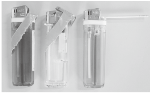
細い棒やテープなどを使い、常にガスが出ている状態にすれば簡単に抜けます。シューと言う音がしていればガスは抜けています。