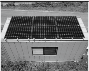
藤森建設株式会社 様 ゴールド・ランク認定 おめでとうございます!

★ごみの受入れや見学等に関するお問い合わせ ながの環境エネルギーセンター TEL 026-224-5600 までお問い合わせください。