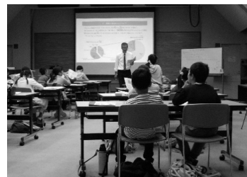
食品ロスの削減に向けて、学習をしています!

今回は、4年生の皆さんに、食品ロス(まだ食べられるのに廃棄された食品)と、これを減らすためにできることを学びました。