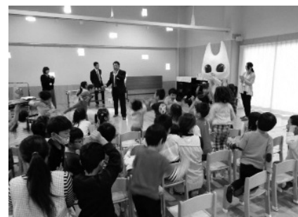
えこねと一緒に分別クイズに挑戦しています!

特に、ごみのサンプルを使って、えこねと一緒に考える「ごみの分別クイズ」では、代表園児の奮闘に、クラスのみんなも盛り上がりしていました。