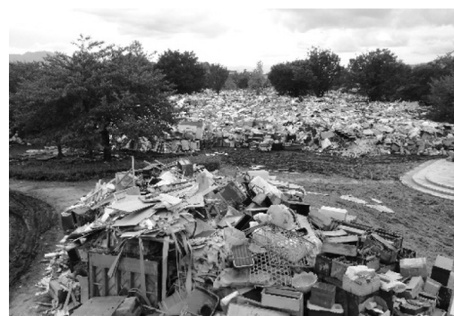
災害ごみ搬出前(赤沼公園)