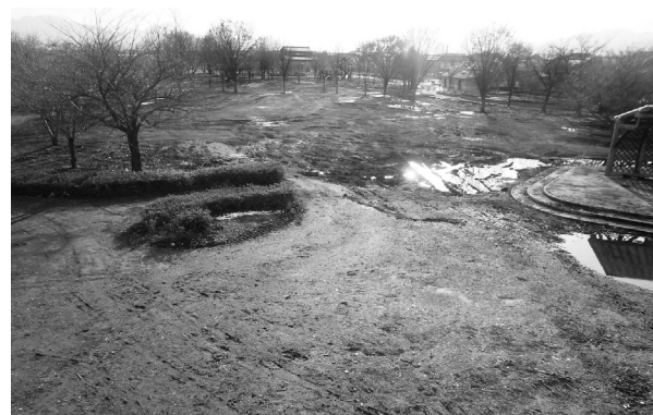
災害ごみ搬出後(赤沼公園)

市民、ボランティアの皆さん、自衛隊、行政などすべての人の力を結集し、被災者のために一丸となって台風19号で発生した災害ごみ等の撤去を行うプロジェクトです。 「ONE NAGANO(ワン・ナガノ)」は、市民、ボランティア、行政などの力を結集し、長沼・豊野地区内に点在する臨時集積所から赤沼公園へ災害ごみを移動し、自衛隊が地区外に搬出しました。自衛隊の活動終了後は、市の委託事業者が搬出しました。 このほかにも国、長野県等を通じた支援要請により、民間事業者、県外からの広域支援、県内市町村のご協力をいただき、災害ごみが搬出されました。