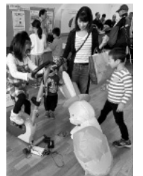
ペダルをこいで風船をふくらませているんですよ

野工業高等専門学校及び長野工業高等学校の皆さんから日頃研究している太陽光や水車のお話を聞きました。 ○体験ブース 自然エネルギーや環境について楽しく学べる体験ブースは大賑わいでした。