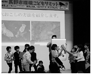
西条小の発表の様子だんや

当日はえねこも参加したんですよ たくさん友だちが来てくれて嬉しかったんですよ ▼令和元年10月27日(日) 長野市リサイクルプラザ(テーマ) 自然のめぐみからのエネルギー地球を未来につなげるために考えてみよう! ○環境活動発表 日頃学校で行っている環境活動について、芹田小、西条小、信州新町小の皆さんが発表しました。