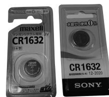
コイン型リチウム電池 主に小型電子機器に使用されており、ボタン電池より薄

○充電式電池(小型充電式電池) デジタルカメラ、コードレス電話(子機)、電動工具等に使用されているニカド電池、ニッケル水素電池、リチウムイオン電池は、小型充電式電池になりますので、充電式電池回収協力店(一般社団法人JBR Cが指定する店舗、ホームページで店舗検索可能)にあるリサイクルボックスに金属端子部分を絶縁の上、出してください。 充電式電池各種のリサイクルマーク Ni-Cd ニカド電池 Ni-MH ニッケル水素電池 Li-ion リチウムイオン電池 リチウムイオン電池の一例 充電式電池各種のリサイクルマーク 充電式電池各種のリサイクルマーク 充電式電池各種のリサイクルマーク