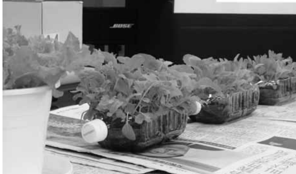
ペットボトルを使った葉野菜の栽培