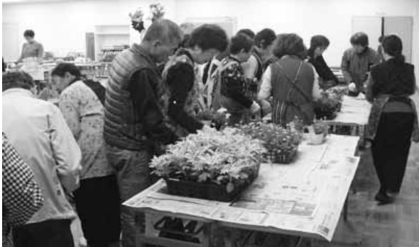
人気の寄せ植え講座