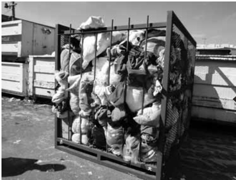
回収された古布類はコンテナに入れて運びます