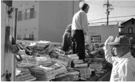
地区の役員が収集車へ積み込み

市内各地域では資源回収が、盛んに行われています。今年度は、一部の団体の活動について「資源回収実態調査」を行い、代表者の方に団体の活動内容、今後の課題などをお聞きしました。資源回収で得た報奨金は、PTA・育成会や地区の活動費、台風や震災の義援金などに使われています。 また、地区の役員が収集車への積み込みを手伝うことで、ごみの出し方のマナーが良くなった地区もありました。 各団体が積極的に資源物を回