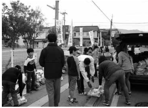
親子いっしょに資源回収

収めることで、リサイクルの向上に繋がっています。しかし、回収された資源物の内訳をみると、古布類が少なくなっています。