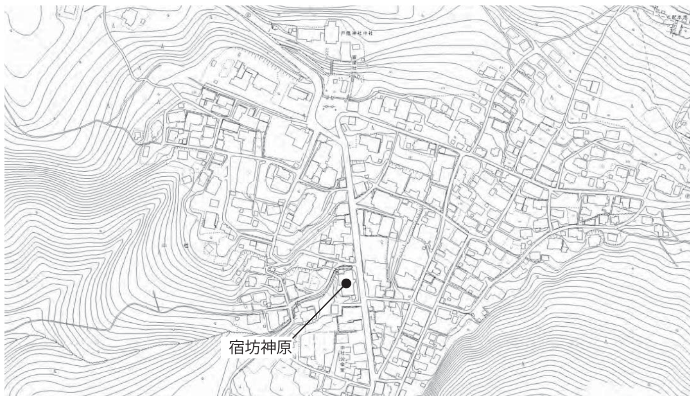
宿坊神原 案内図 S=1:5,000