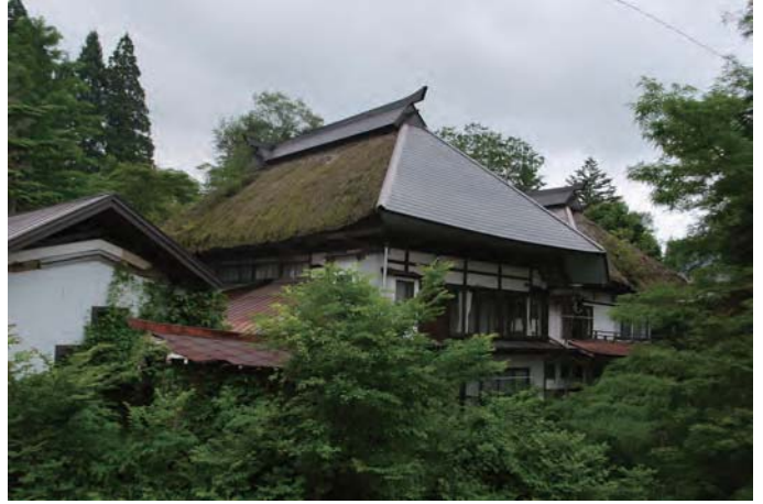
写真2 宿坊外観（北西から）