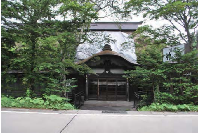
写真1 宿坊外観（東から）