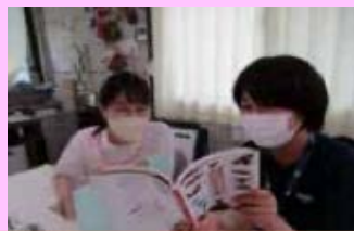
【休憩】保育室から離れて 体を休めます