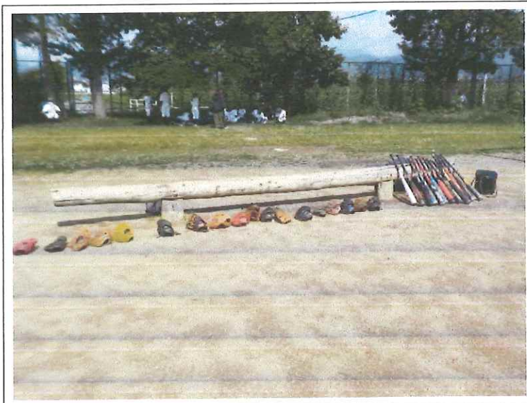
柳原ファイヤーズ 練習グラウンド