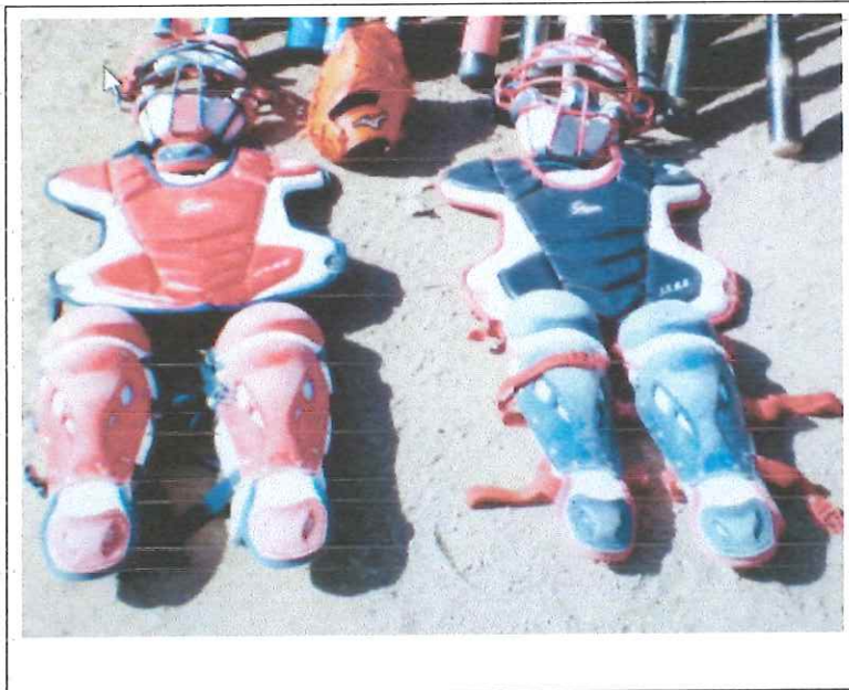
キャッチャー 用 レガース 2個 プロテクター 2個 マスク 2個