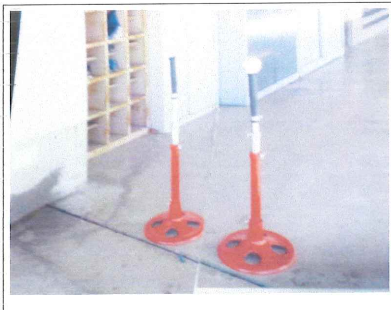
バッティングティー 2台