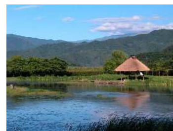
▲かわなかじまこせんじょう 川中島古戦場 しせきこうえん 史跡公園