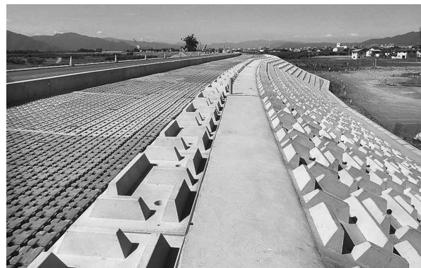
長沼地区穂保に整備された被覆型堤防

地域の要望を聴きながら研究する。国は、令和元年東日本台風時の流量解析や堤外地の農地土砂撤去の状況も考慮し、横断測量等を行っている。国が必要と判断すれば、高水敷の土