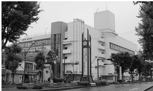
イトーヨーカドーの閉店に伴い活性化のための計画が見直される権堂地区