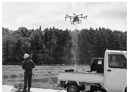
先端技術を活用したスマート農業