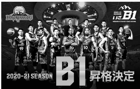
今シーズンからB1リーグに参戦する信州ブレブウォリアーズ

市長 ホームアリーナ以外の長野運動公園総合体育館については、令和9年国体開催時には設備の老朽化がさらに進むと予想されることから、改修などにより機能、利便性の向上