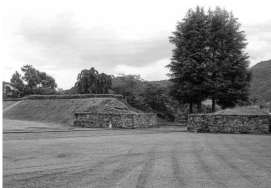
門礎石が残る松代城石場門跡

教育次長 文化庁との協議を再開する。やぐら等復元も学術的調査や復元的整備の進め方を協議し判断する。