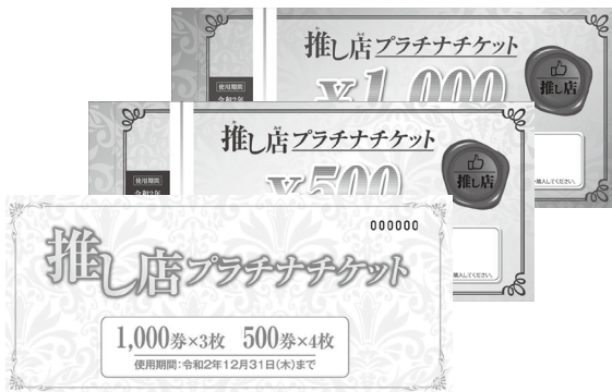
市内の飲食店や小売店等が販売する「推し店プラチナチケット」(見本)

問 新型コロナウイルス感染症により落ち込んだ、市内経済の回復に向けての今後の新たな支援はどうか