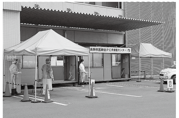
ドライブスルー方式で検査ができるPCR検査センター

保健所長 風邪症状、行動歴や基礎疾患等で柔軟に検査した。今後二カ所のPCR検査センター等で一日八十検体の検査が可能となり、県全体で五百床の病床を準備する。アビガン等、治療薬は医療機関で対応して