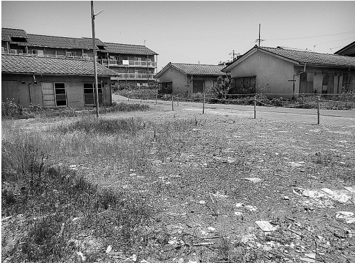
豊野地区美濃和田に整備される災害公営住宅の予定地

る。仮住まいを余儀なくされている被災者が、安全で安心して暮らしていけるよう整備を進めていく。