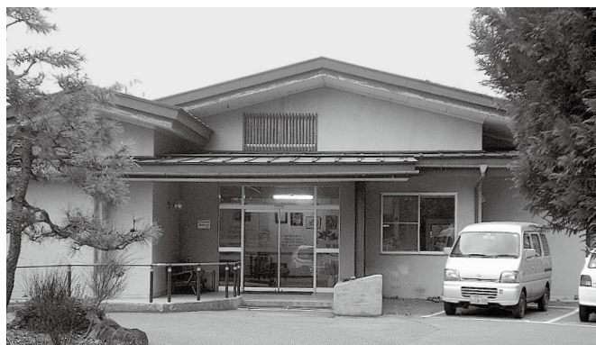
若槻老人憩の家。令和3年4月以降は民間による運営が予定されている