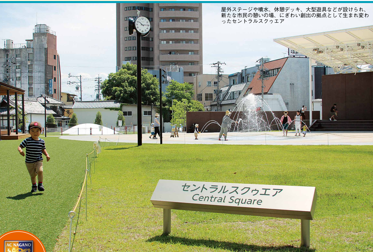
屋外ステージや噴水、休憩デッキ、大型遊具などが設けられ、新たな市民の憩いの場、にぎわい創出の拠点として生まれ変わったセントラルスクエア