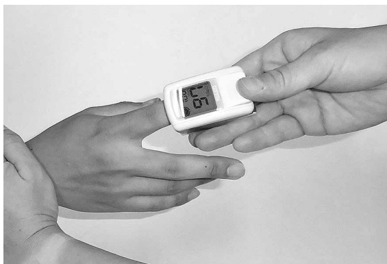
酸素飽和度を計測するパルスオキシメーター