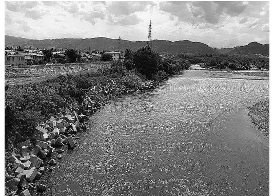
堤防の強化が望まれる犀川・楯花川の合流点