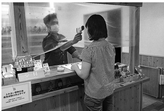
観光施設で行われている感染症対策

商工観光部長 3密回避や感染症予防対策を充実し、新生活様式の観光ニーズに対応した観光振興策を展開。誘客範囲を段階的に拡大し、観光地や観光産業、指定管理者への支援についても引き続き検討していく。