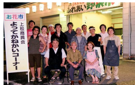
お花市よってかねかいコーナー