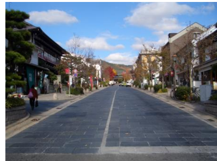
石畳の表参道が商店街の目抜き通り