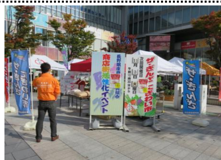
ザ・ぎんざにぎわい市

長野駅と善光寺を結ぶ表参道（中央通り）に、「もんぜんぷら座」「TOiGO」を有し、昔ながらの商店街に健康や美容に関する店舗が多く混在していることが特徴。「TOiGO 広場」では、年間通じて様々なイベントが開催され、新たな街の賑わい創出の起点となっている。「人が集まる街」「活気のある街」「誇れる街」を目指して、新しい街づくりに組合員一丸となって取り組んでいる。