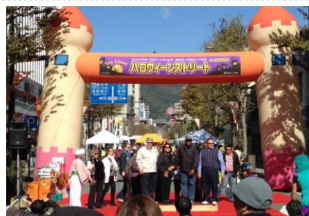
ハロウィーンストリート