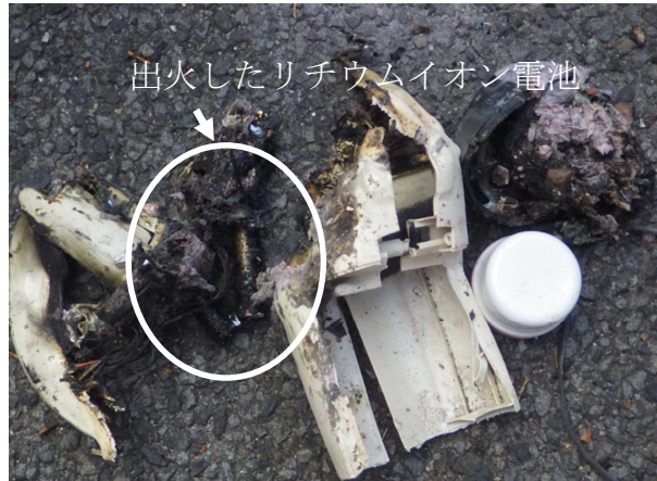
ゴミで出され家電製品内にあったリチウムイオン電池