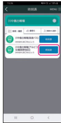
乗車するバス停を検索して「時刻表」を選択。