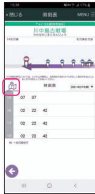
バス停に接近するバスの運行状況が、時刻表と併せて画面上でわかります。