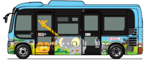
34人乗り(座席12、立席21、乗務員1)でノンステップ、車イス用スロープ完備。