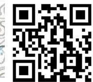
(予約サイトQRコード)

予約先 026-262-5325 バス予約センター 電話受付時間 平日 午前8時30分～午後5時 (土日・祝日・お盆・年末年始除く) WEB https://naganodemand.fjodt.com (24時間予約可能)