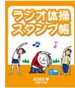
ラジオ体操スタンプ帳表紙イメージ