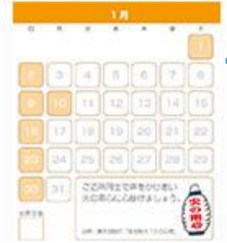
スタンプ帳1月分カレンダーイメージ