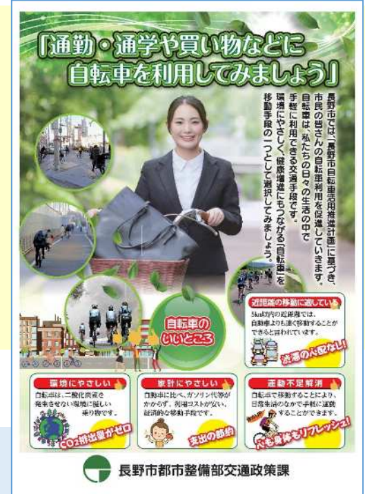
長野市都市整備部交通政策課