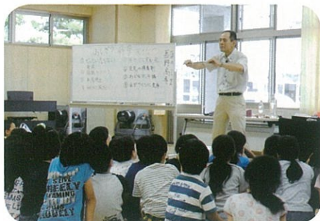
ふしぎ? 科学マジック

子どもプラザ・児童センターとも、子どもたちが毎日を楽しく、安全・安心に過ごせるよう職員一同取り組んでまいりますので、ご支援、ご協力をいただきますようお願い申し上げます。