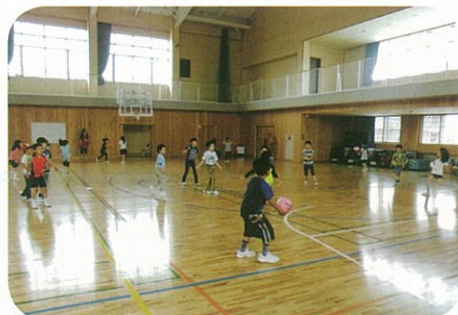
体育館でドッジボール