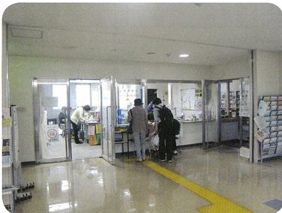
長野市吉田公民館 事務室 かがやきひろば吉田

吉田地区住民自治協議会では、長野市吉田公民館と吉田老人福祉センター(かがやきひろば吉田)を、長野市から指定管理者として受け、その運営を今年の四月からスタートしました。 今後一層、時代の流れや地域のみなさんのニーズを捉え、地域の特色を出す事業の企画・運営を推進し、吉田地区のキャッチフレーズ「人の和と地域の輪もて我が吉田」づくりを目標に、地域のみなさまが、年代を超え、一人でも多く利用され、人と触れ合い、結び合いを深めていただけるよう努めて参ります。 これからも、ご支援、ご協力をよろしくお願ひ申し上げます。