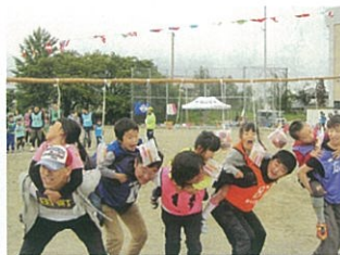
親子パン食い競争