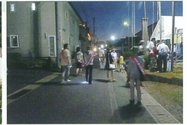
子ども達に声をかけながらのパトロール（夏まつりにて）