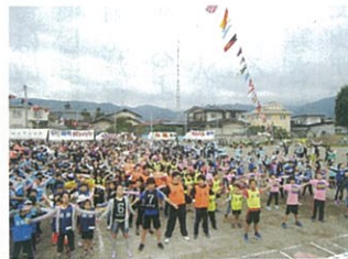
全員でラジオ体操