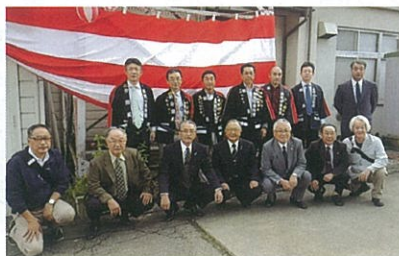
警鐘打鳴設備のお披露目

の季節、寒さが厳しくなり、火災が発生しやすい時期となりますので、今一度「火の用心」をお願いいたします。