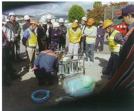
泥水から飲用水を作る実験