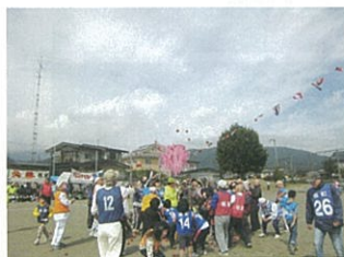
紅白対抗仲良く玉入れ