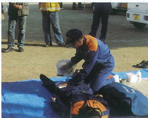
けが人応急処置訓練

また、情報伝達訓練(各町避難状況の確認)長野市消防局若槻分署による(けが人応急処置、三角巾使用)訓練も実施され、参加者が交代でけが人となり応急処置訓練を行うことで両者の気持ちを理解する事ができました。