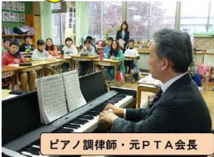
ピアノ調律師・元PTA会長

通明小学校6年生の総合的な学習の時間「 今と未来をつなぐ学習 」の様子です。2時間続きのため児童は、2講座を選択し、学習できました。