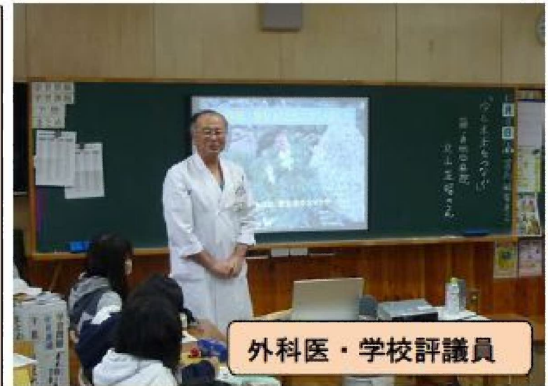
外科医・学校評議員

通明小学校6年生の総合的な学習の時間「 今と未来をつなぐ学習 」の様子です。2時間続きのため児童は、2講座を選択し、学習できました。