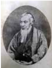
◀山寺常山画像