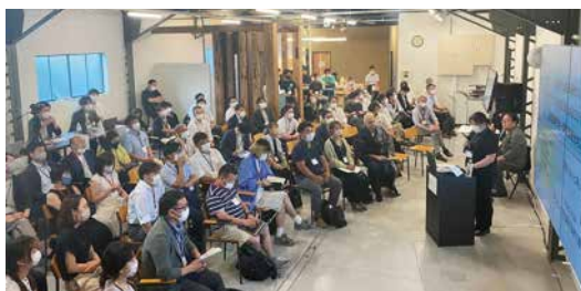
▲集まった人々の前でアイデアを発表(NSS)

熱意を持った仲間がたくさん集まっています。温めているアイデアがある人、まずはお話ししたり、イベントに足を運んでみたりしましょう！