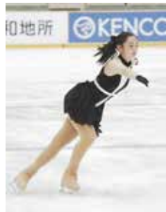
～昨年度(第43回)大会の様子～