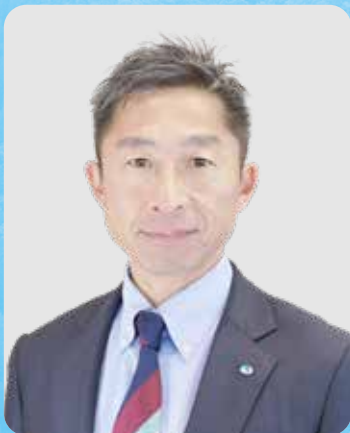
長野市長 荻原 健司

結びに、今年1年の皆さまのご多幸とご健康を心から祈念申し上げ、新年のごあいさつといたします。