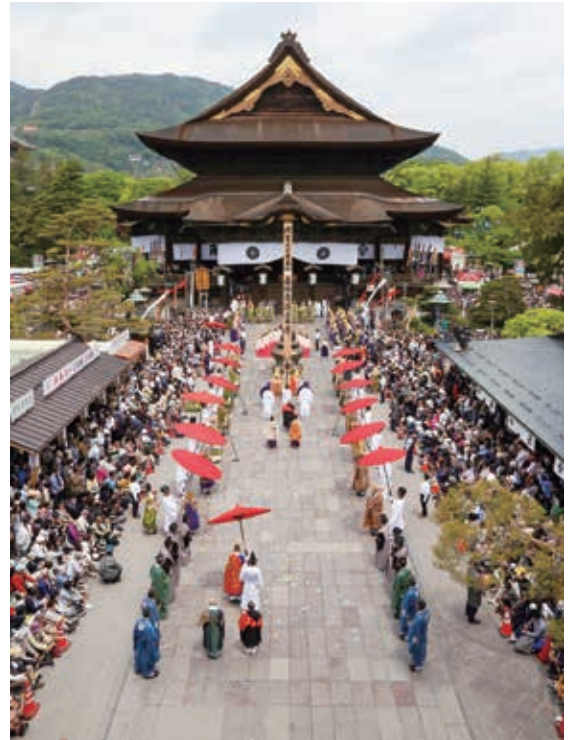
中日庭儀大法要(浄土宗)