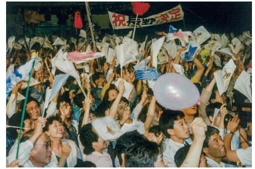
善光寺境内で開催決定に沸き立つ人々