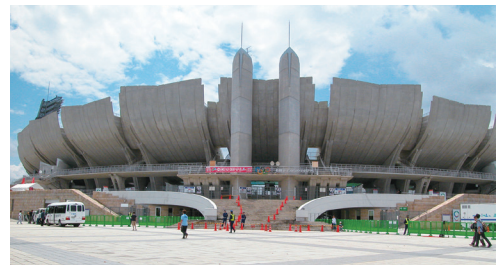
長野オリンピックスタジアム