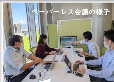
ペーパーレス会議の様子