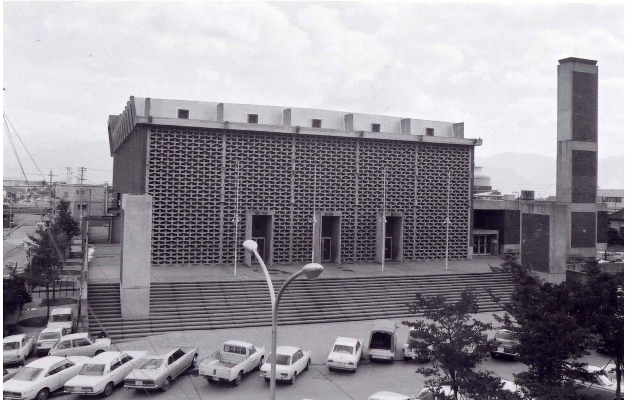
長野市民会館全景

なお、昭和34年7月3日、市民会館に併せて長野市庁舎も隣接して移転建設することが決議されました（旧第1庁舎）。この市庁舎の設計も佐藤氏で、建設着工は昭和39年4月、翌40年10月18日に竣工しています。