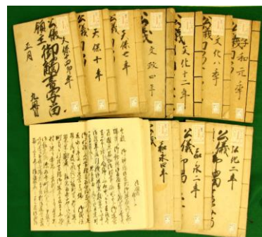
「公儀・領主御触書写留」 1冊目(享和)~14冊目(安政) (綿内村役場文書1)