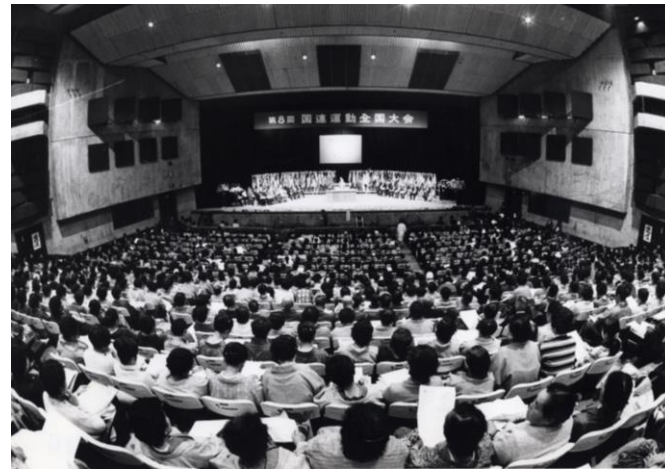
第8回国連運動全国大会（昭和46年10月11～12日）