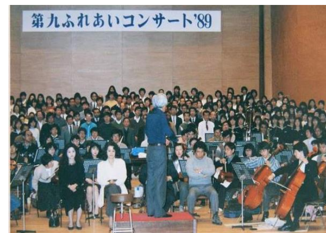
第九ふれあいコンサート'89（平成元年度）