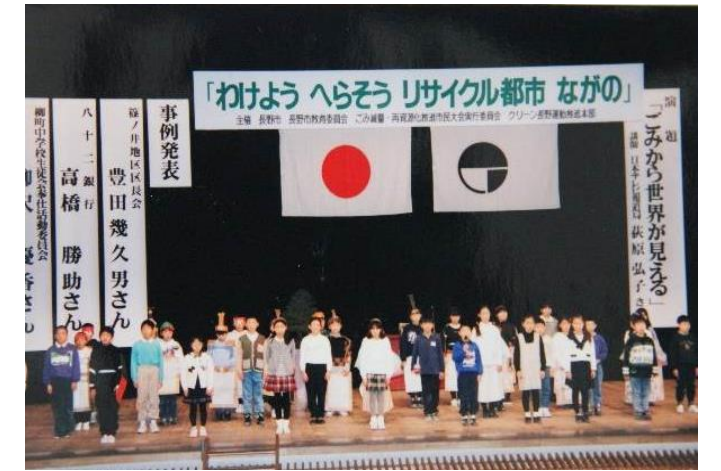
ごみ減量・再資源化推進市民大会（平成6年度）