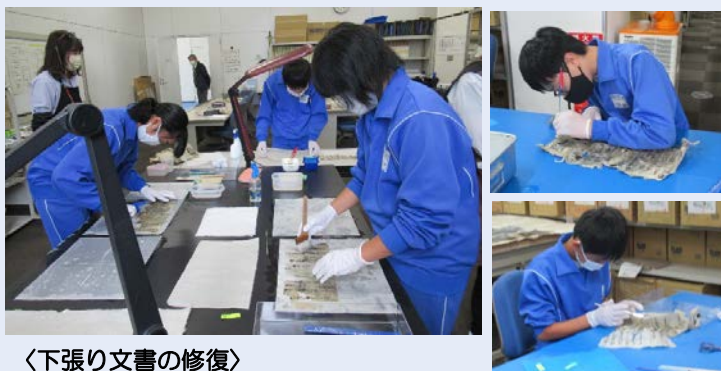
〈下張り文書の修復〉

～襖の下に幾重にも貼られていた古文書は、汚れたり破れてしまったりしているため、「丁寧に水洗いする」「和紙で裏打ちする」などの修復作業を行います～