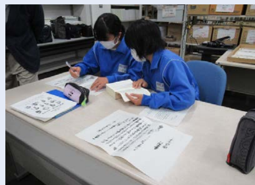
〈古文書の学習・解読〉 昔の人の書いた見慣れない崩字 を苦労して解読し、その内容に ついて学習しました！

長野がかなり昔から存在し、国の中でも割と重要な場所であったことが分かった。古文書や地図一枚を完璧に保存していた。古文書をきちんと番号に分けて保存していることが分かった。