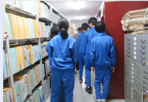
〈館内見学〉 保存文書を実際に手に取って みました！

歴史を残すということは、とても意味があって大切な仕事だということが分かりました。また、公文書館の歴史や活動について知れたので、これからは親しみをもって地域の一員として積極的に接していきたいです。