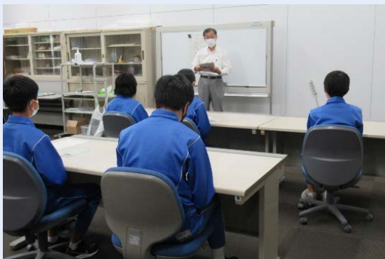
〈館長の話と 公文書館紹介スライドの視聴〉

中学生の皆さんにとって、公文書館はあまり馴染みのない施設であり、はじめの内はどんな仕事を体験するのだろうといった不安や緊張の様子も伺えましたが、公文書館紹介のスライドを見たり館内に所蔵されているたくさんの文書を見学したりすることを通して、当館の役割や仕事の内容を理解してもらうことができました。また、長野市公文書館が制作したDVD作品『ふるさと長野～カイブ君の歴史探訪～』の視聴や、専門主事や文書調査員の指導による「古文書修復作業」「古文書の解読」などの作業体験に熱心に取り組む中で、「仕事に携わること」の大変さやおもしろさ、やりがいなどを感じてもらえたのではないかと思います。生徒の皆さんにとっても私たち職員にとっても、とても有意義な3日間となりました。