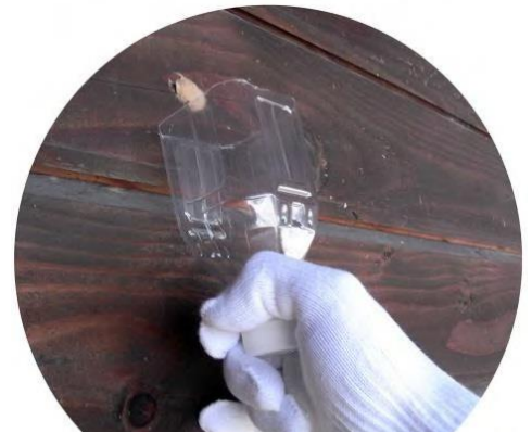
ペットボトルを利用した卵塊の除去方法

また、長野市ホームページに「ペットボトルを利用した卵塊の掻き取り用具の作り方」を掲載していますので、参考にしてください。