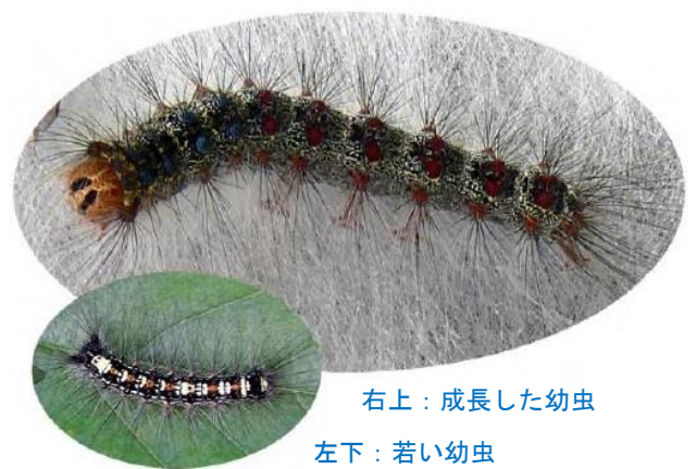
右上：成長した幼虫

火ばしなどで捕まえ、つぶすか少量の家庭用洗剤を溶かした水に漬けて駆除することが効果的です。