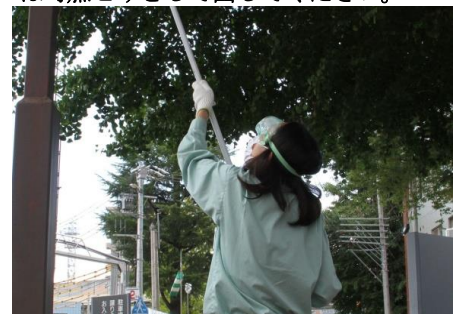
H26.9.26 市有施設の卵塊一斉除去の様子

成虫や卵塊への作業の際は、舞い上がった鱗毛が目に入ったり吸い込むことを防ぐため、手袋・マスク・ゴーグルを着用してください。