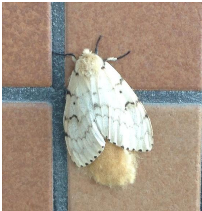
メスの成虫と卵塊

また、概ね10年周期で大発生し、終息までには3年程度かかると言われていることから、大発生した後の数年間は、特に注意が必要になります。