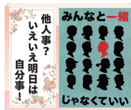
令和5年度 人権啓発ポスター・標語コンクール 一般の部 最優秀賞作品