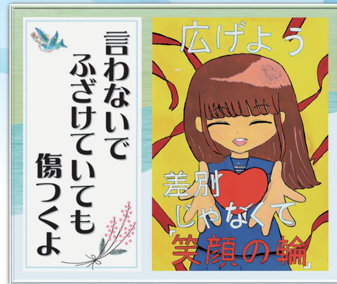
令和5年度 人権啓発ポスター・標語コンクール 小学生・中学生の部 最優秀賞作品