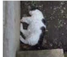
大ケガをした後、身を潜められるところで死亡した猫