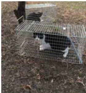
対象の猫を捕まえて (T r a p)