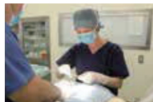
手術して (N e u t e r)