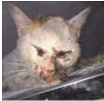
病気に感染した猫

以下の写真は屋外で弱っているところを保護したり、死亡していたりした猫のほんの一例です。長野市では、毎年多くの猫が屋外で死亡しています。外にネコちゃんを出す前に、「外に出した代償」についてもお考えください。