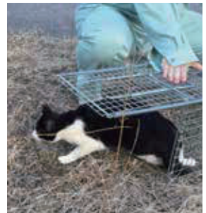
元の場所に戻す! (R e t u r n)