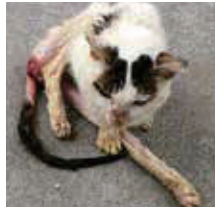
ケガにより下半身が動かなくなった猫