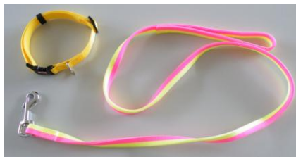
首輪、リード(引き綱)