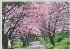
O 農業大学の桜並木