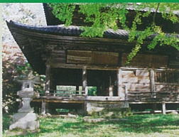
Ⅲ 清滝観音堂(信濃三十三番札所 11番札所)

自然の四季折々に、魅力ある山のトレッキングを、それぞれのコースで大いに満喫しよう!また史跡・文化財など多くの名所・旧蹟も訪ねてみよう。