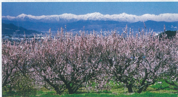
東条あんず(杏)の里から遠く北アルプスを望む