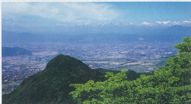
奇妙山中腹、高見岩上から見た長野市街と北アルプス(手前は尼巖山)

長野市の南南東に位置している尼巖山・奇妙山及び周辺は、豊かな自然や史跡・文化財等に恵まれています。 尼巖山西山麓には、国蝶オオムラサキ、また同山頂付近には、ヒメギフチョウが飛び交います。山城跡や古墳群、石幢や石垣など多くの石の文化財も。静かな山裾には、ゆったりとあんず(杏)の里や肥沃な田園が広がっています。