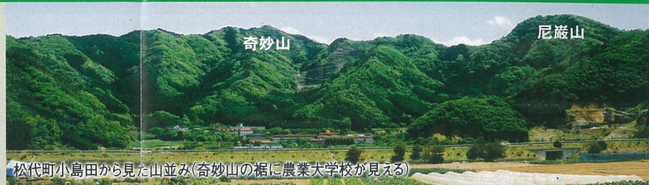
松代町小島田から見た山並み(奇妙山の裾に農業大学校が見える)