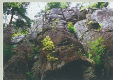
P 尼巖山の岩場(巨岩)