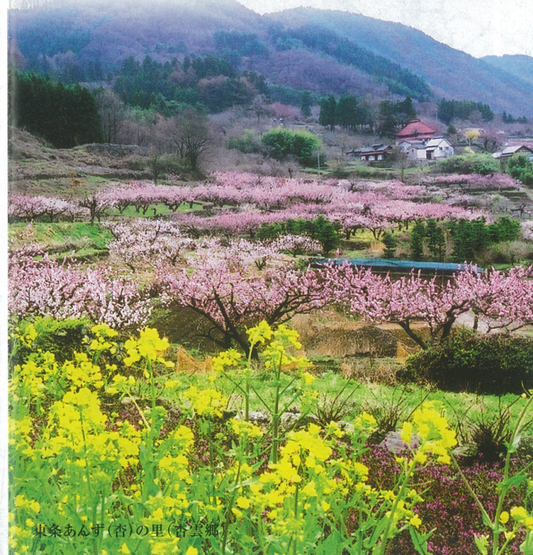
東条あんず(杏)の里(杏雲郷)