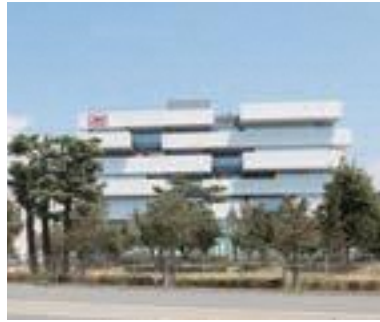
127 日本無線 先端技術センター