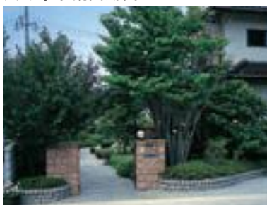
77 笹岡邸 庭園