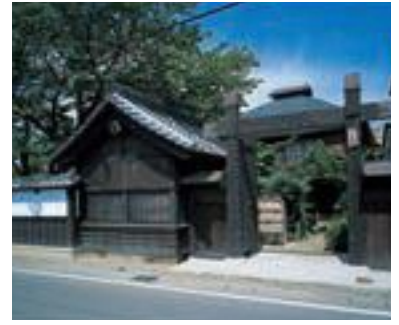
55 歳寒亭 冠木門・番所