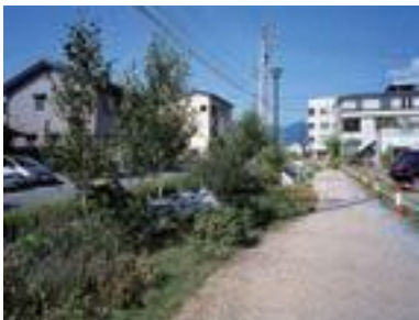
100 みんなで北中を良くする会 (団体)