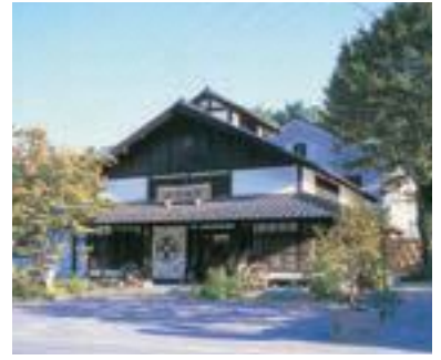
104 いろは堂 鬼無里本店