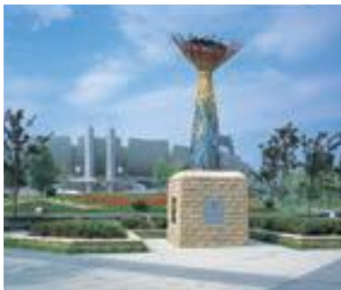
75 南長野運動公園 (公共)