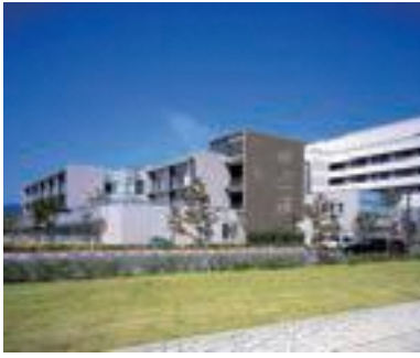
97 長野市民病院 中央棟、南病棟 (公共)