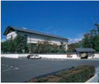
73 財団法人 水野美術館