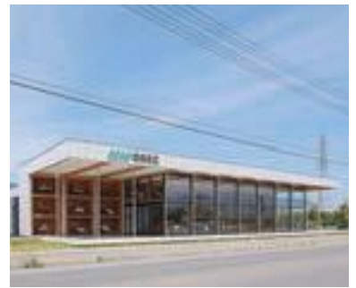
134 OREC green lab 長野