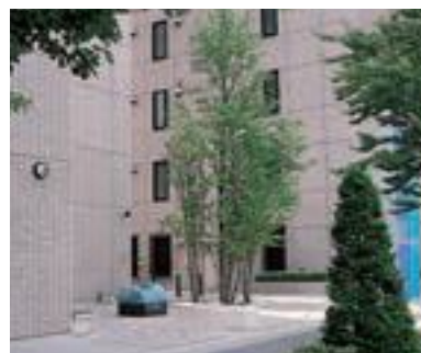
12 Nagano, Odori, Intelligent, Plaza