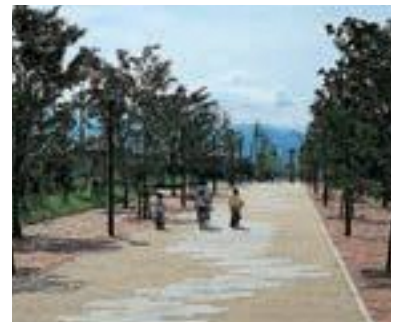
28 長野市三本柳土地区画整理組合 (団体)