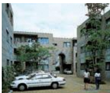
34 グランドハイツ御所