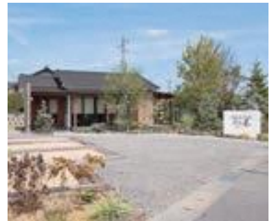
133 Café du Cache ぶなの木