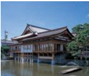
48 善光寺大勧進 紫雲閣