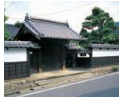
68 山本邸 門と塀