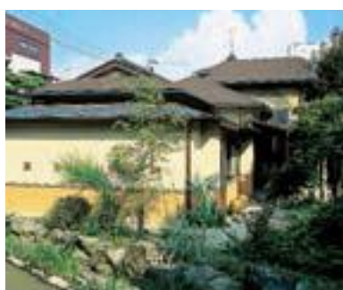
32 セセラギの住まい