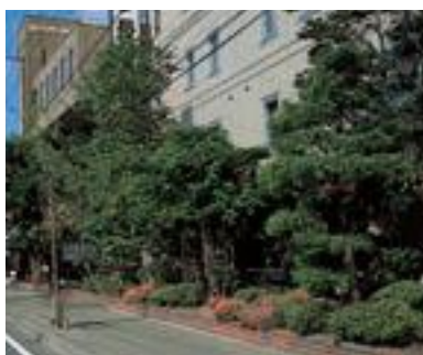
10 オフィスホテル ルートイン長野