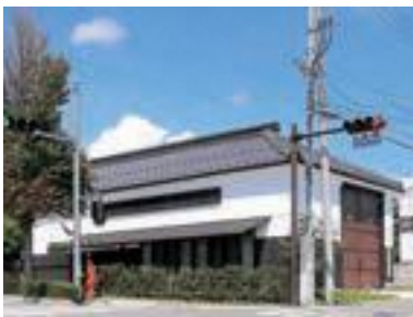
125 東町屋台蔵・東司 (公共)