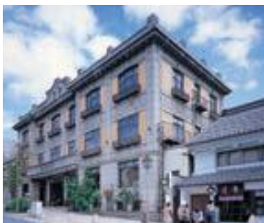
89 THE FUJIYA GOHONJIN