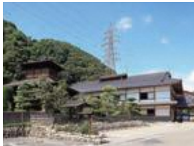
111 すき亭本館と洗心亭