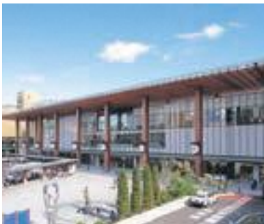
124 JR 長野駅 新駅ビルと善光寺口駅前広場