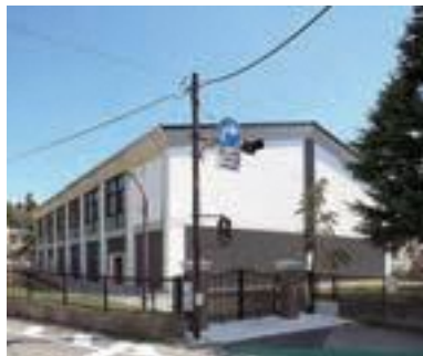
110 城山小学校体育館 (公共)