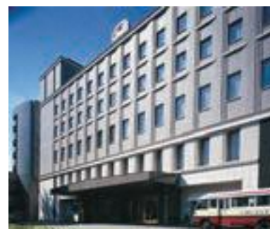
41 長野ホテル犀北館 新本館