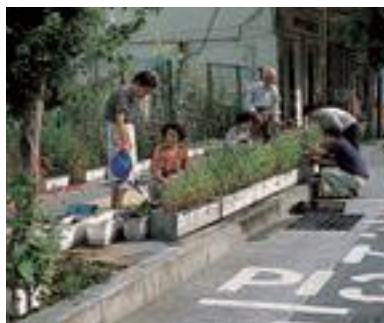
1 長野市緑と花いっぱいの会 (団体)