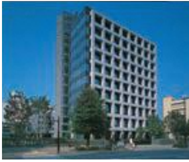
59 長野県信用組合 本店