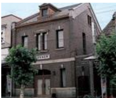
20 長野市物産館 (公共)