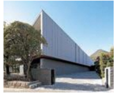
117 八十二銀行研修所