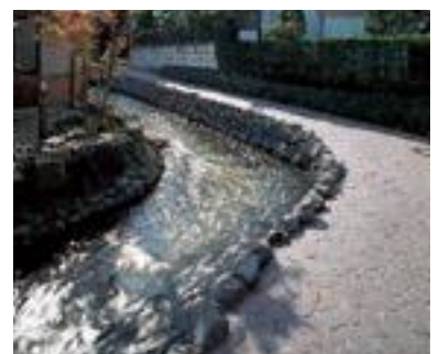
30 南八幡川親水性水路 (公共)