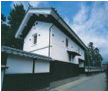
60 長屋門(土蔵)と土塀