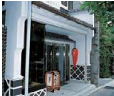
22 (有)八幡屋磯五郎 (平成20年建替え)