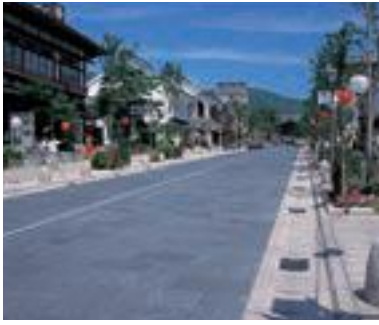
46 中央通り 修景事業 (公共)