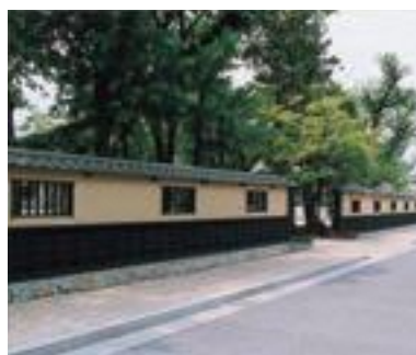
66 松代小学校・塀と歴みち(公共)