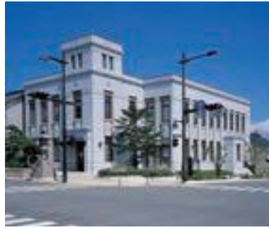
51 八十二銀行 大門町支店