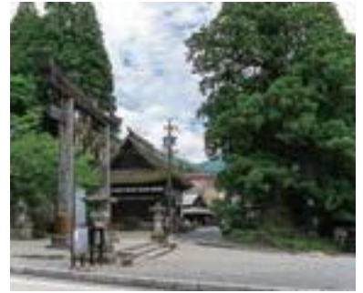
132 戸隠中社・宝光社地区まちづくり協議会 (団体)