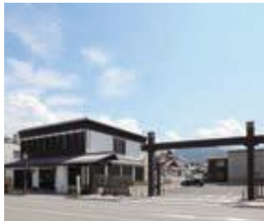
109 長野県信用組合松代支店 店舗と駐車場の門