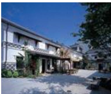
88 ぱていお大門 蔵楽庭