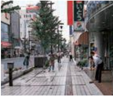
16 表参道街づくり協議会 (団体)