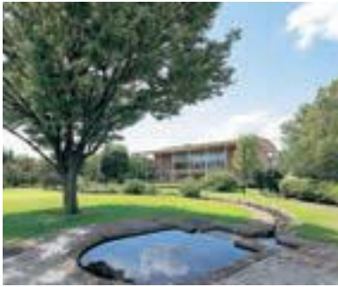
122 新光電気工業株式会社 栗田総合センター