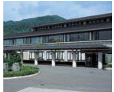
27 長野市安茂里総合市民センター (公共)