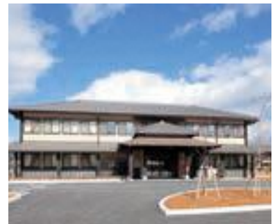
119 松代小学校 (公共)