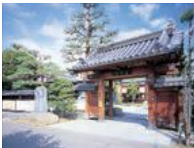
91 デイサービス 高田がっこう