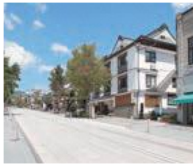
129 善光寺表参道の歩道拡幅と石畳化 (公共)