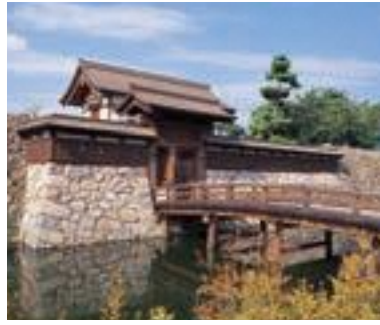
78 松代城跡 (松代城公園) (公共)