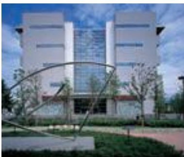
50 信越郵政研修所 (公共)