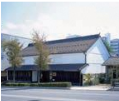
99 長野市立博物館付属施設 門前商家 ちよっ蔵おいらい館 (公共)