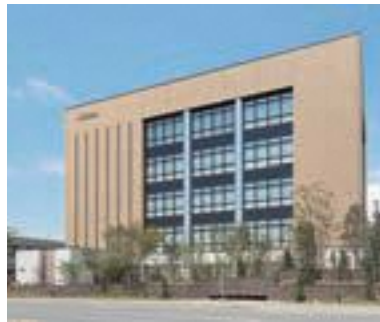
128 ミヤマ株式会社 本社