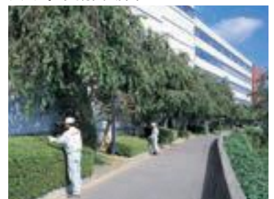
86 マルコメ 裾花川堤防植栽と管理