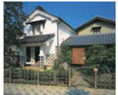
70 郷土人形館「ひなの家」