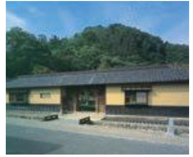
82 山寺常山邸 (公共)