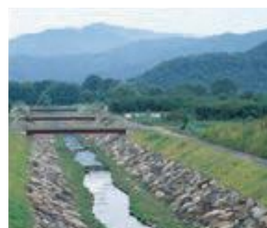
45 神明広田都市下水路堤外水路 (公共)