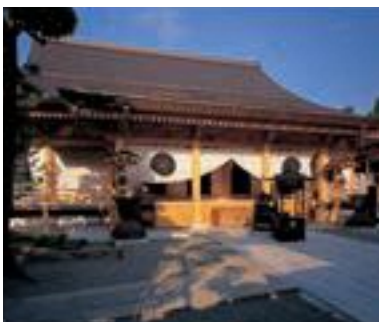
49 善光寺大本願 本堂及び渡り廊下・中庭庭園