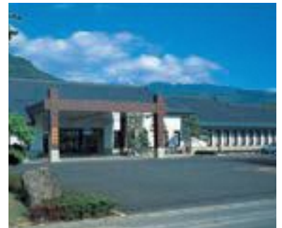
56 国民宿舎 松代荘 (公共)