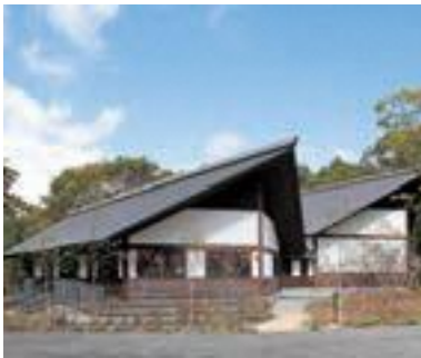
123 北野美術館 戸隠館