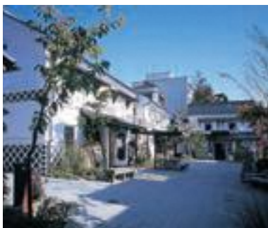
88 ぱていお大門 蔵楽庭 〈平成18年度 長野市景観賞受賞〉