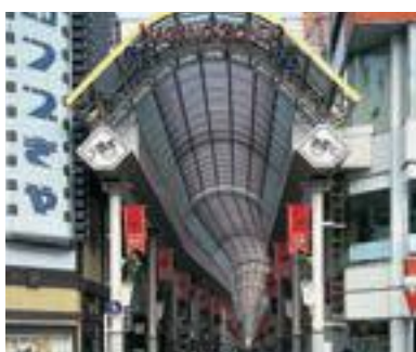
37 権堂商店街アーケード通り