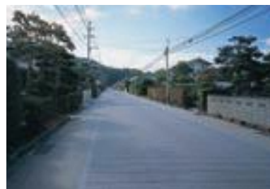
94 長野市道町川田大門線(公共)