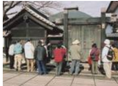
NPO法人夢空間松代のまちと心を育てる会(団体)