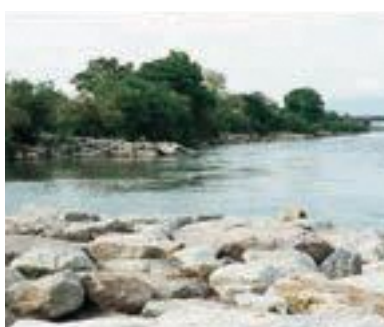
40 ひふみ淵 (公共)