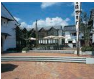
36 善光寺外苑「西之門」