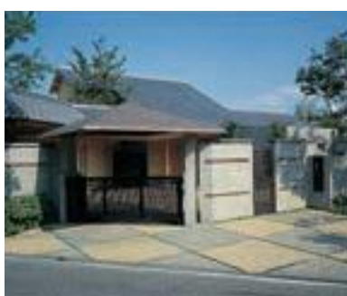
38 修景と住まい (仁科邸)