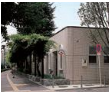
19 藤棚のオアシス (公共)