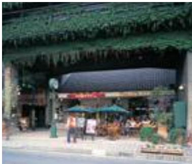
74 アイビスクエア (守谷第一ビル)