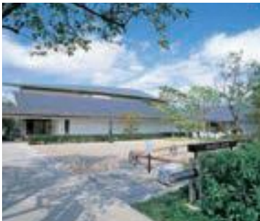
47 竹風堂松代店 池田満寿夫美術館