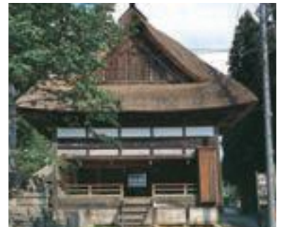
83 中社五斎神社 拝殿