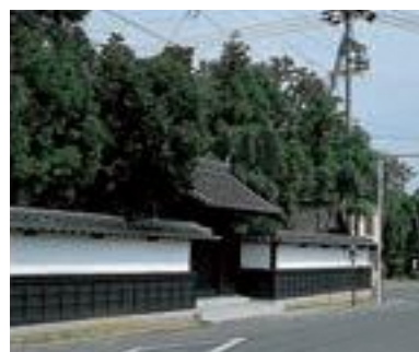
15 真田道泰邸 門と堀