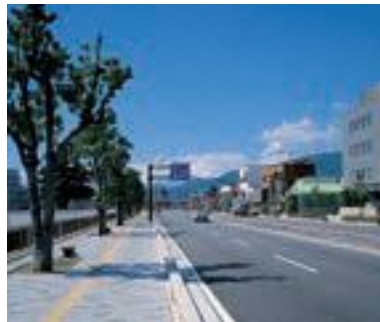
52 県道・三才大豆島中御所線 改良事業 (公共)