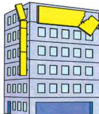
倒壊又は落下のおそれがあるもの