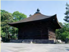
善光寺経蔵

善光寺経蔵の耐震性能並びに耐震上の課題を把握した上で、全面的な構造補強及び保存修理を行う。