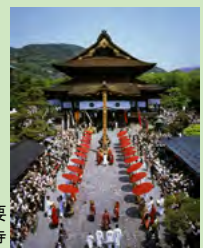
中日儀大法要

善光寺では、数え年で7年に一度の丑と未の年に前立本尊の御開帳が催されています。期間中は、「中日儀大法要」をはじめ、様々な法要等が行われます。