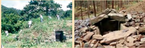
保存会による草刈り

大室古墳群には、石を積み上げて墳丘とした「積石塚」や「合掌形石室」と呼ばれる特異な構造の埋葬施設が集中しています。これらは、大正時代初期より、大室地区の地元住民を中心とした保存会によって、保存・継承されています。