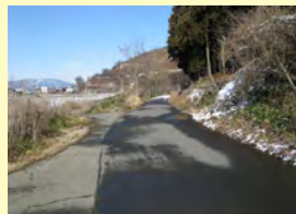
史跡大室古墳群に通じる現道