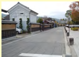
松代地域道路美装化路線