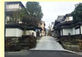
善光寺周辺地域電線類地中化路線

国道403号線から国史跡大室古墳群までのアクセス道路により、誰もが訪れやすくするとともに、周辺の歴史文化資産を活かす道路として整備を進める。