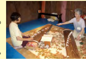
文化財ボランティア