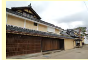
寺町商家（旧金箱邸）

北国街道松代道周辺の文化財や歴史的建造物等を、ゆつたりと周遊できる道を整備する。