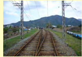
文化財等周遊道路整備