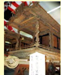
鬼無里神社の屋台