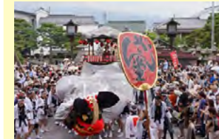
弥栄神社の御祭礼

神楽・屋台を保存するとともに、透かし彫りの龍や唐獅子、牡丹など優れた技術の情報発信を行う。