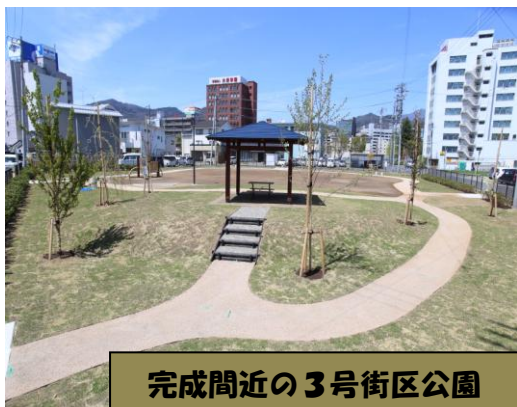
完成間近の3号街区公園

引き続き、地域の皆様のご理解とご協力をいただき、国及び長野県など関係機関と連携し、今後一層の事業進捗をよくが図られるよう鋭意努力して参りますのでよろしくお願ひします。