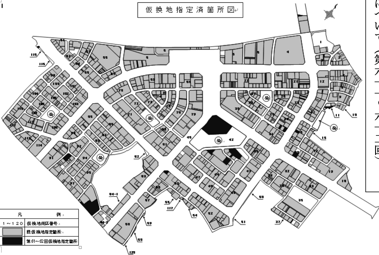
仮換地指定済箇所図