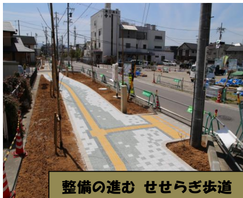
整備の進むせせらぎ歩道