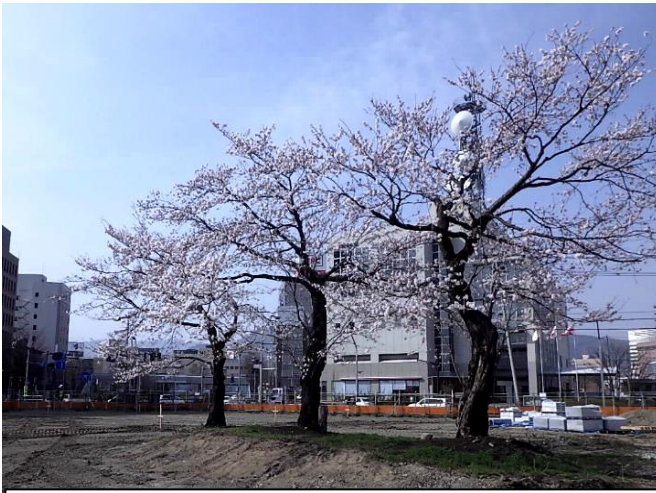
旧整備局事務所北側の桜の木 今年も見事に咲きました

とさせて頂きました。権利者の皆様には大変ご迷惑をおかけすることになります。今後一層の事業進捗が図られるよう鋭意努力して参りますので、引き続き、ご理解とご協力をお願いして新任のあいさつとさせて頂きました。