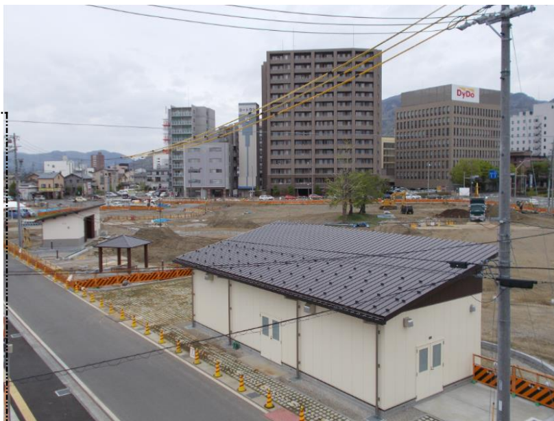
近隣公園整備状況 防災備蓄倉庫、多目的トイレ等を整備しました

最初に、道路等で囲まれた街区の出来形確認測量を工事が完成した箇所から実施していきます。 その後、皆様の換地の出来形確認測量を実施します。これが換地計画に反映する換地地積となります。 特に平成三十年夏頃から約二年間、測量に必要な杭や標識の設置(毀損・亡失の復元を含む)及び計測のため、皆様の土地に立ち入ることがあります。その際はご理解ご協力をお願いします。