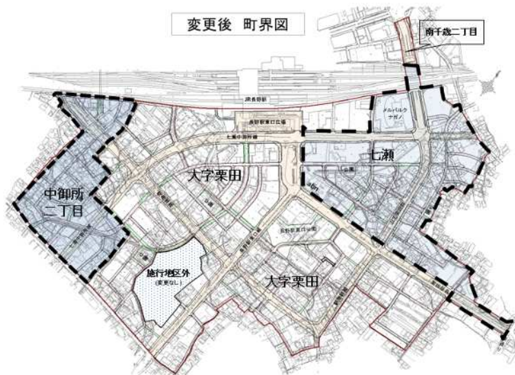
七瀬の例：長野市七瀬1番1(1-1)、1番2(1-2)

番、1画地毎は枝番となる「1番1、1番2、2番1、2番2」とする地番振りに修正します。 *街区は、道路等で囲まれた複数の画地です。