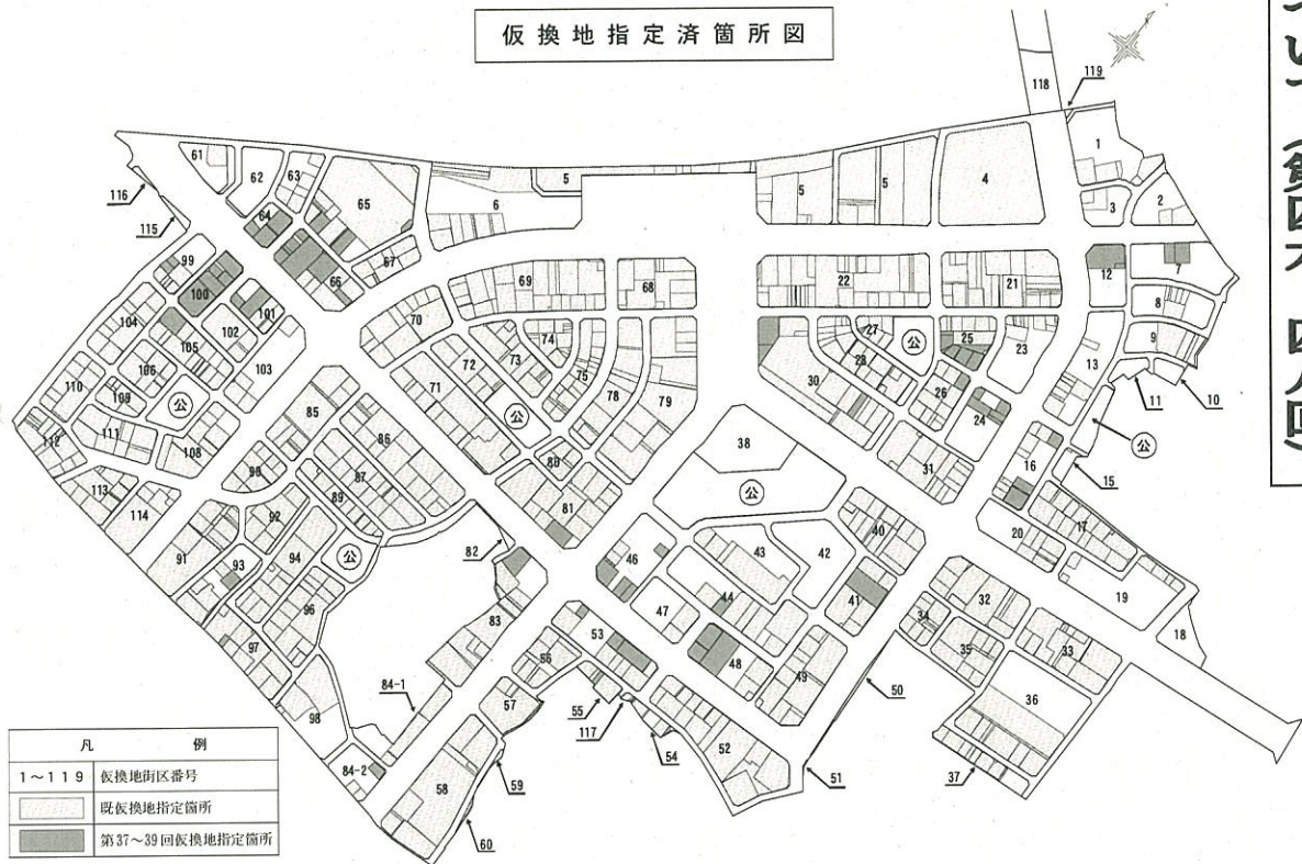
仮換地指定済箇所図