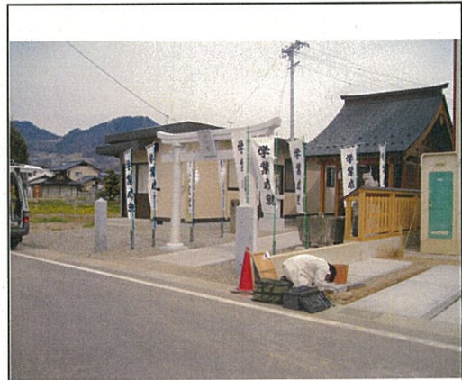
遷座しました (八幡宮・御所天満宮)