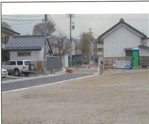
整備が進んでいます (栗田地区)