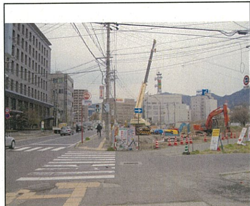
整備が進んでいます (慈天堂さん跡付近)