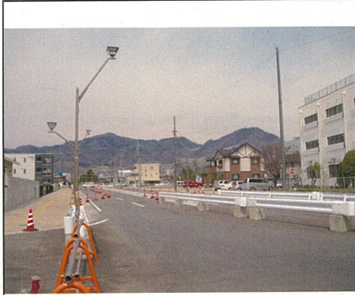
一部開通します (駅南幹線)