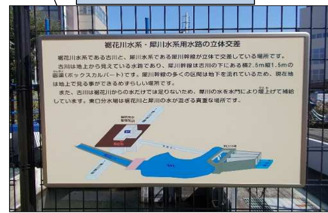
サイン看板 (用水路の立体交差)