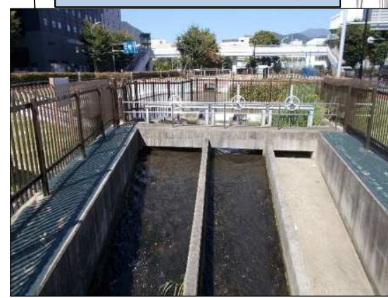
山王堰用水東口分水場