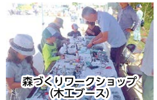
森づくりワークショップ（木工ブース）

いうイベントを行っています。このイベントでは、森についての学習会や森林整備の体験とともに、様々な団体による木工作や木を使ったゲームなどを体験することができ、子どもから大人まで楽しく森林や木にふれ合っているような内容となっております。