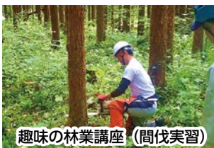
趣味の林業講座（間伐実習）

市では、市民の皆様に森林や林業について興味・関心を持っていただくことを目的に、各種体験活動を行っております。