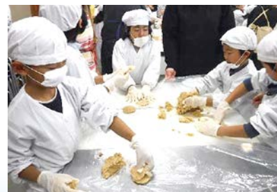
○今年度は浅川小学校、三本柳小学校、芹田小学校で計9回の講座を開催

材料を全部混ぜ、桶に詰めやすいように握りこぶし位の大きさにまとめていきます。 粘土をこねる要領で、楽しく作業が進みました。 (芹田小学校)