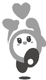
ながの健やかプラン21 シンボルマーク なっぴい

市保健所健康課では、こころの健康、ゲートキーパー、健康的なお酒との付き合い方などをテーマに「出前講座」を実施しています。地域や職場で研修会、勉強会などを計画していただき、申し込みを希望する人や、講座の詳細を知りたい人は、市保健所健康課へお問い合わせください。