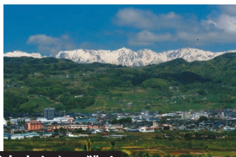
妻女山からの眺め