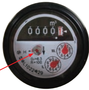
パイロットの確認