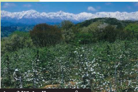
りんご畑と北アルプス